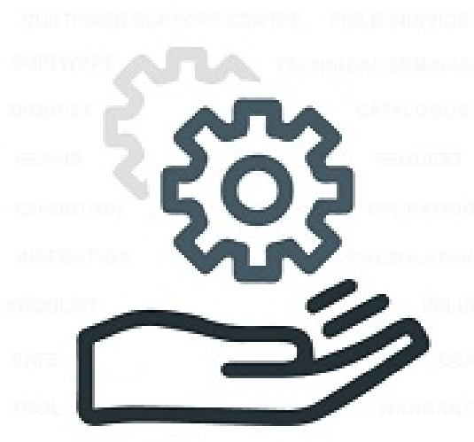
การบริการ