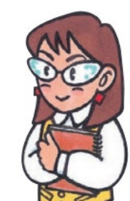
Oriental Motor Sales Executive