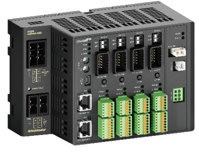
Multi-Axis Driver Supports EtherCAT Communication

DC Power Supply, 2 Axis AZD2A-KED ราคา 25,493 บาท