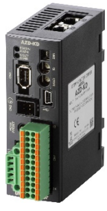
Pulse Input Type with RS-485 Communications