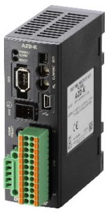
Pulse Input Type