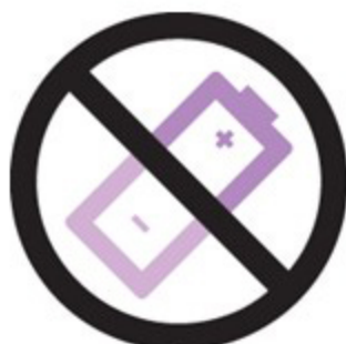
ไม่ต้องใช้แบตเตอรี่