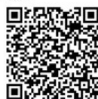
สแกนเพื่ออ่านข้อมูลเพิ่มเติม