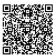
สแกนเพื่อดูราคา

AZ ซีรีส์ ถูกใช้เป็นตัวขับเคลื่อนในแอคชูเอเตอร์หลากหลายประเภท