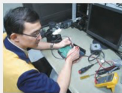
ตรวจสอบและซ่อมแซม