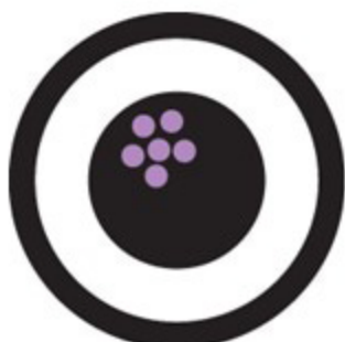
สามารถทำซ้ำและแม่นยำ