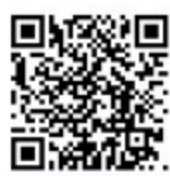
สแกนเพื่อดูวิดีโอ

AZ ซีรีส์ เป็น สเต็ปป์มอเตอร์ closed loop \alpha STEP