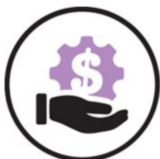
ประหยัดค่าใช้จ่าย