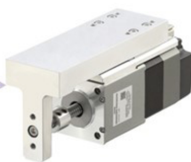
DRS2 ซีรีส์ ลิเนียร์แอคชูเอเตอร์ขนาดเล็ก

AZ ซีรีส์ ถูกใช้เป็นตัวขับเคลื่อนในแอคชูเอเตอร์หลากหลายประเภท