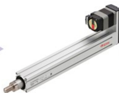
EAC ซีรีส์ ไชลินเดอร์