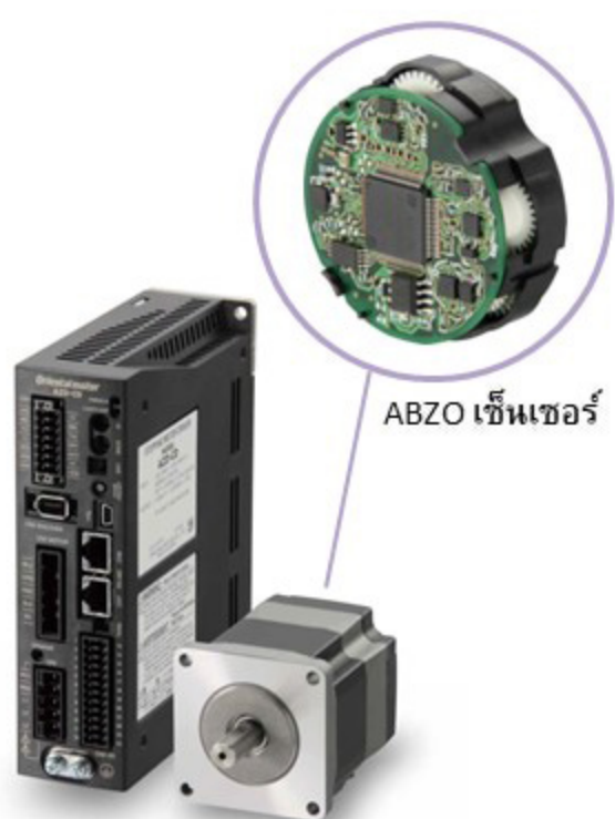
ABZO เซ็นเซอร์

AZ ซีรีส์ เป็น สเต็ปป์มอเตอร์ closed loop \alpha STEP