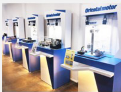
ขอแค็ตตาล็อก